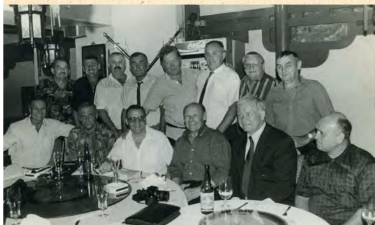
S jednog od posljednjih okupljanja veterana osječkog boksa u Royalu

Sveukupno, zbog karijere, ali i želje da osječki boksači opet postanu ljubimci sredine u kojoj djeluju, Matkovića s pravom treba svrstati u plejadu najvrsnijih promotora „plemenite vještine“ uopće.