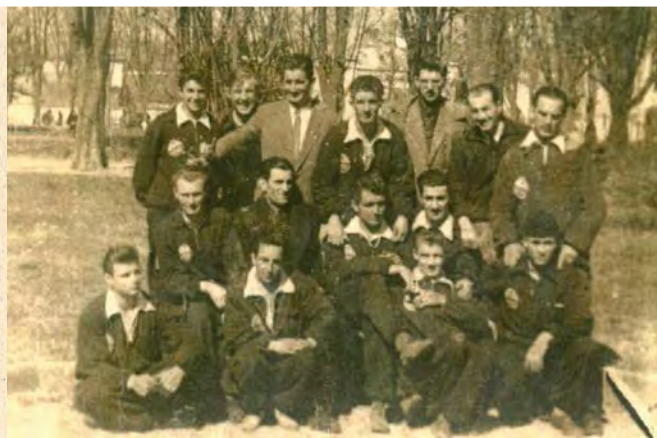
Osječki boksači iz davne, 1949. godine